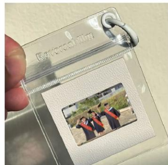
原資中心畢業禮物 限量客製化製作